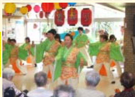
そーらん のみなさん